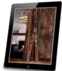
Auch fürs iPad erhältlich